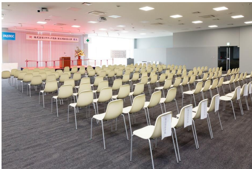
コンベンションホール