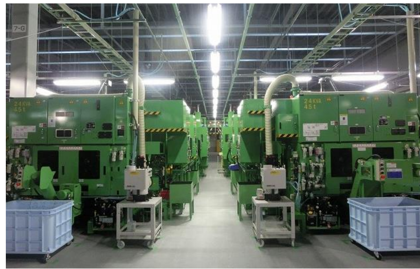
工場棟内部 生産設備