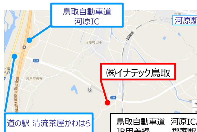
道の駅 清流茶屋かわはら