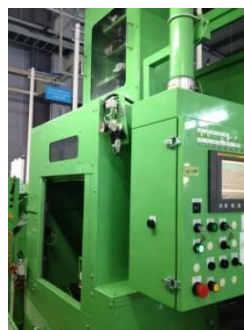
【ブローチ盤】 山陽マシン製 5T600ST-NCBR