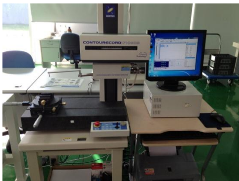
【形状測定機】日本製 東京精密製 CONTOURCORD 1710SD3-12