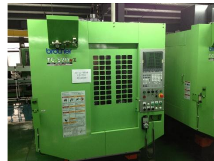
【マシニングセンター】現調化 ブラザー製 TC-S2D(中国生産)