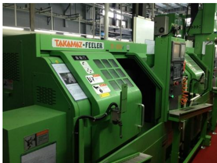
【NC旋盤】現調化 高松機械製 X150C(中国生産)