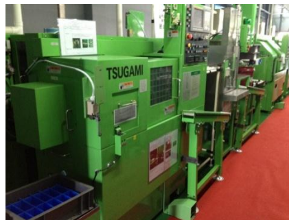
【円筒研磨機】現調化 津上製 G18-II SB(中国生産)