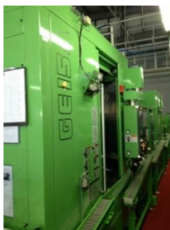
【ホブ盤】 三菱重工業製 GE-15A