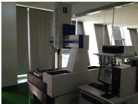
【3次元測定機】日本製 東京精密製 XYZAX SVA 600A-C6