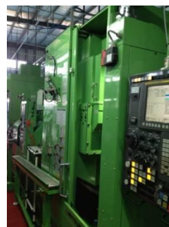
【ギヤシェーパー】 三菱重工業製 SE-15A