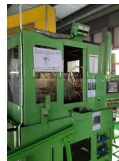
【高周波焼入機】 GMエンジニアリング製 (専用機)